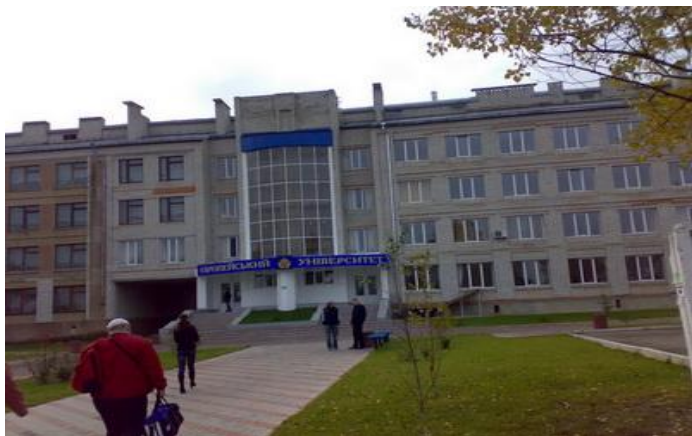
Будівля Житомирської філії Європейського університету, в якій проходила конференція