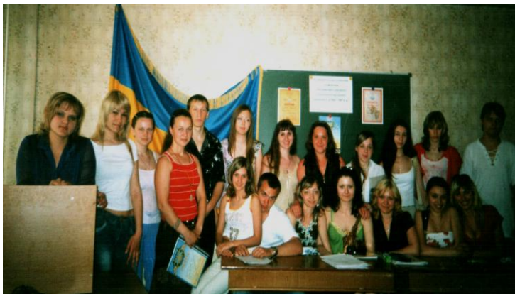
Учасники II загальноуніверситетської студентської конференції «Підсумки життєдіяльності СПУ за 2006-2007 н.р.»