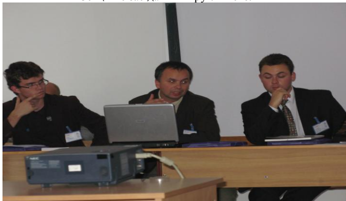
Представники польської молодіжної організації