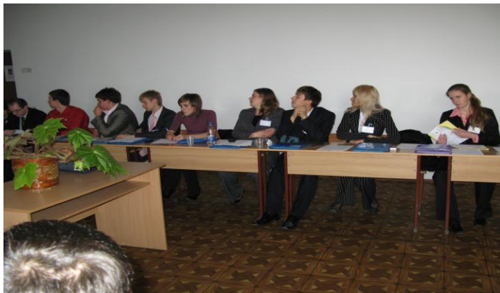
Секційне засідання «Круглих столів»