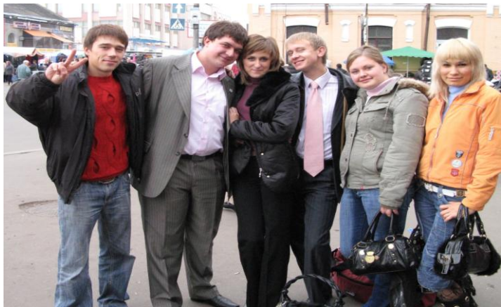
Зустріч учасників конференції в м. Житомир