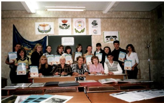
Учасники ІІІ загальноуніверситетської студентської конференції «Підсумки життєдіяльності СПУ за 2007-2008 н.р.»