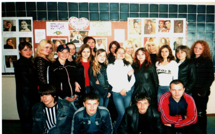
Студентський парламент 1 курсу (2005-2006 н.р.)