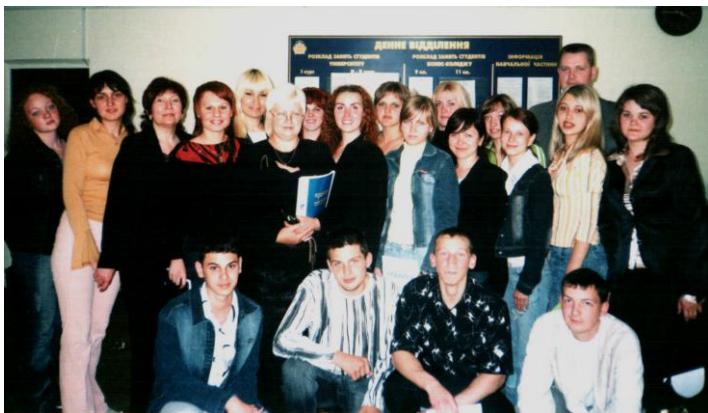
Учасники I загальноуніверситетської студентської конференції «Підсумки життєдіяльності СПУ за 2005-2006 н.р.»

«круглих столів». Ось чому у Нікопольській філії студентському самоврядуванню відводиться провідна роль. Адже Національна доктрина розвитку освіти націлює нас на найперші позиції, які має забезпечувати система освіти - це формування особистості, яка усвідомлює свою належність до українського народу, зберігає і продовжує українські культурно - історичні традиції, шанобливо ставиться до рідних святинь, української мови, історії, а також до культури всіх національностей, які проживають в Україні, виявляє культуру міжетнічних і міжособистісних стосунків. Тому професорсько-викладацький склад філії веде молодь через лабіринти плідної праці, навчання й відпочинку, формує при цьому національну свідомість і самосвідомість, власну гідність, вселяючи віру у власні сили, збуджуючи прагнення власною працею зробити життя кращим, а не бути пасивним споживачем. Ми хочемо, щоб студенти, як майбутні фахівці, створювали таке суспільство, в якому б їм хотілося жити. Тож успіхів усім у розв'язанні цих важливих завдань.