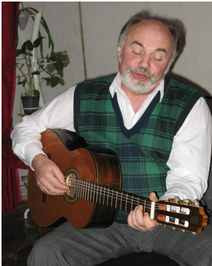
Голова проекту «Срібна вежа»