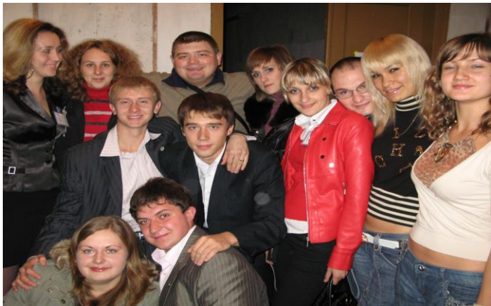
Лідери студентського самоврядування філії Європейського університету – учасники конференції