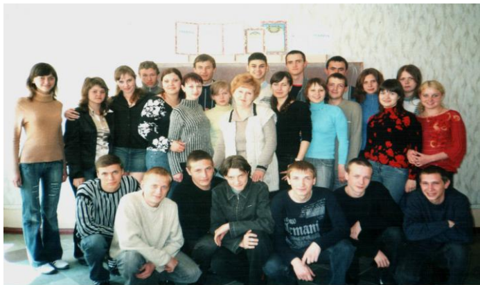
Студентський парламент 3 курсу (2005-2006 н.р.)